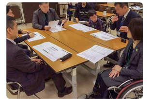
自社の取組の振り返り