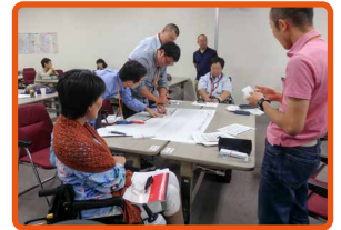
障害当事者とのグループワーク