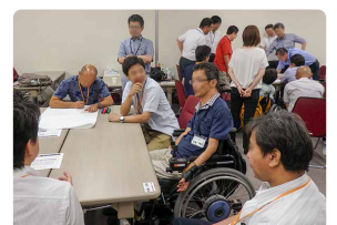
当事者とのディスカッション

このプログラムは一例であり、実際の研修時には各コマの配分時間が変わる場合があります