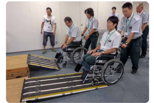
基礎的な介助方法の実技 (車いす)