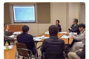
グループ内での発表・意見交換