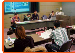
障害当事者からの講義