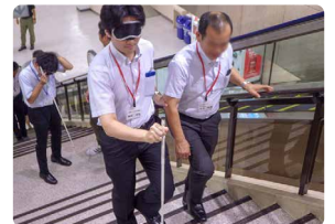
基礎的な介助方法の実技 (視覚障害)